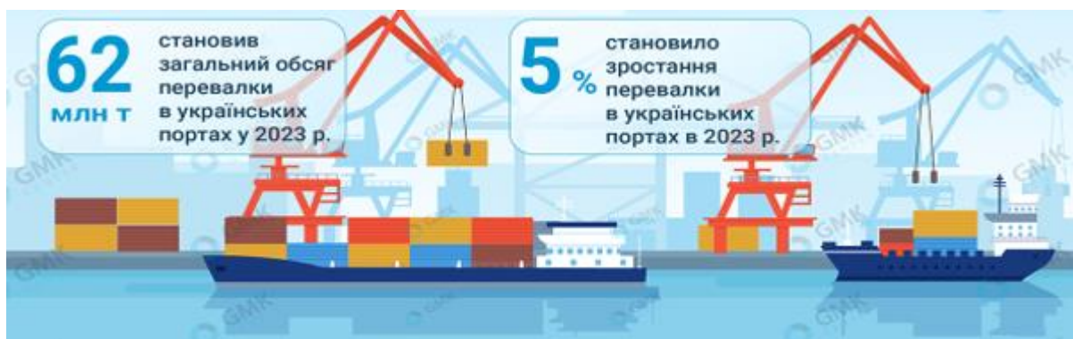
Рис. 1. Перевалка вантажів в українських портах у 2023 роках

Використання послуг кваліфікованих експедиторських та митно-брокерських посередників сприяє підвищенню обсягів зовнішньоторгових операцій завдяки залученню капіталу посередників при здійсненні транспортних, страхових та сервісних операцій, покладання ризиків, пов'язаних з доставкою вантажів на посередни-