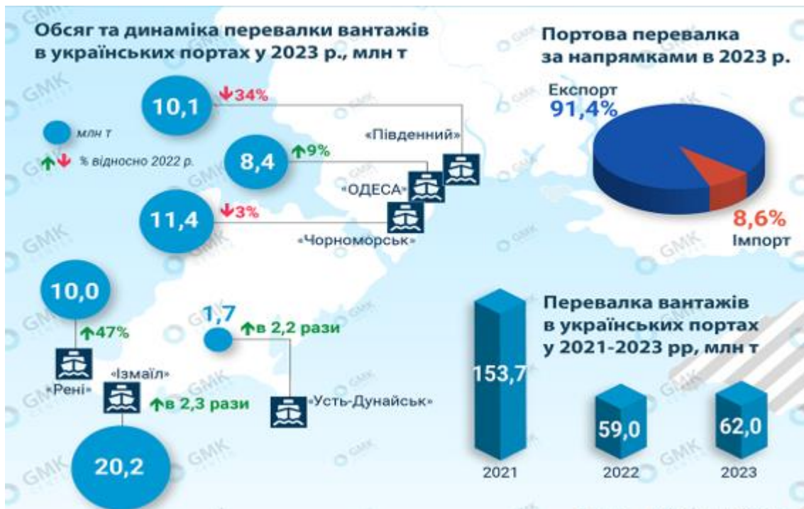
Рис. 2. Портова перевалка за напрямками у 2023 році

ків, швидкого реагування посередників на зміни кон'юнктури ринку.