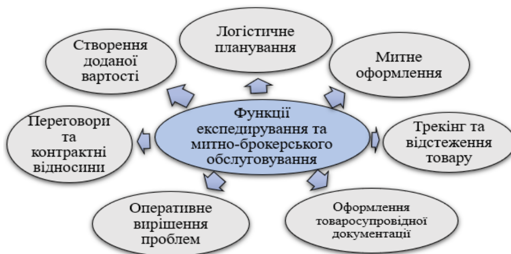
Рис. 3. Спільні функції експедирування та митно-брокерського обслуговування вантажів

2) розвиток тих галузей, що є імпортозамісними і їх подальша експортна орієнтація за умови повного задоволення потреб внутрішнього ринку в цих товарах;